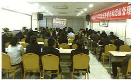
本报讯(集团机关 龙庆宏报道)12月18日上午10时,庆祝改革开放40周年大会在北京人民大会堂隆重举行。会议回顾改革开放

40年的光辉历程,总结改革开放的伟大成就和宝贵经验,动员全党全国各族人民在新时代继续把改革开放推向前进,为实现“两个一百年”奋斗目标、实现中华民族伟大复兴的中国梦不懈奋斗。中共中央总书记、国家主席、中央军委主席习近平在大会上发表重要讲话。12月22日,兰海集团组织全体员工观看了庆祝改革开放40周年大会盛况视频,大家聚精会神地聆听和学习了习近平总书记的重要讲话,在感受到改革开放40年来祖国发展巨变强劲脉搏的同时,也对未来充满了干劲和信心。