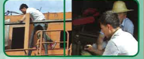
检修和维护设施、设备,为仓储作业提供保障,面对高空、高温环境,维修人员无所畏惧,无私奉献。

司索工——最脏、最累、最危险的岗位,夏天,天气炎热,烈日直射,铁轨上、钢材上散发出的热量,常常使他们还没工作,浑身衣服便已湿透。经常性的户外作业和艰苦的工作环境,使他们的脸晒黑了,皮肤粗糙了,但他们却从不说苦,尽职尽责,没有惊天动地的事迹,更没有什么豪言壮语,他们在平凡的工作岗位上默默奉献着。